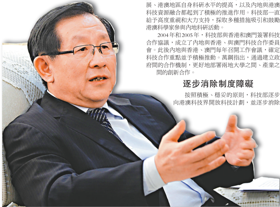
▲全國政協副主席、科技部部长萬鋼接受大公報總編輯賈西平專訪時表示，香港的科技成果轉化、知識產權保護的經驗值得內地借鑒

港澳科技界參與內地科技計劃的制度障礙。目前，主要國家科技計劃「973」、「863」等均已允許港澳科研機構和人員以項目成員（單位）身份參與研究。萬鋼指出，港澳科研人員在國家科技計劃項目中的身份角色也越來越重要，從最開始的參與、到擔任首席科學家、再到整個團隊的參與，2011年開始，港澳大學可以單獨承擔國家科技計劃項目。