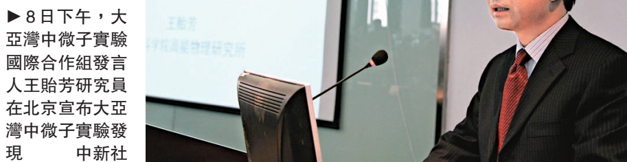
►8日下午，大亞灣中微子實驗國際合作組發言人王貽芳研究員在北京宣布大亞灣中微子實驗發現

每台探測器高5米、直徑5米、重110噸，均置於10米深的水池中。實驗由中國、美國領導和俄羅斯、捷克及中國香港與台灣科學家共同參與。