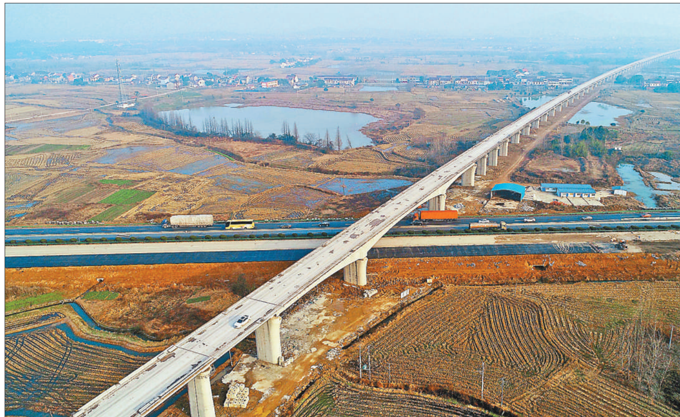
合安高铁庐江站前段完成架梁施工90%以上

一版责编：杨旭 张晔 张帅祯 二版责编：吴燕 黄超 郭雷岩 三版责编：牟宗瑞 李刚 徐伟 四版责编：袁振喜 陈亚楠 杨烁壁